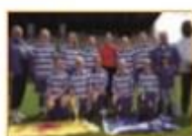
2013 / K.S.C