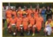
2016 / AR10 Madrid