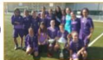
2017 / St-Etienne