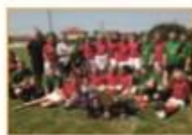
2014 / Manchester City